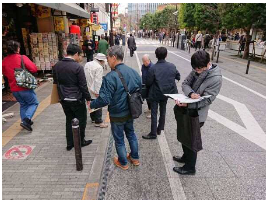
茗溪(めいけい)通り